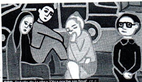
POP. Detalle de la obra 'Otra noche sin final'.

La galería Altamira abrió ayer la exposición 'La noche no es para mí', del artista salmantino Chema Alonso. Su lienzo, de estilo pop, pretenden llevar a la reflexión sobre situaciones cotidianas, en este caso, el mundo de la noche.