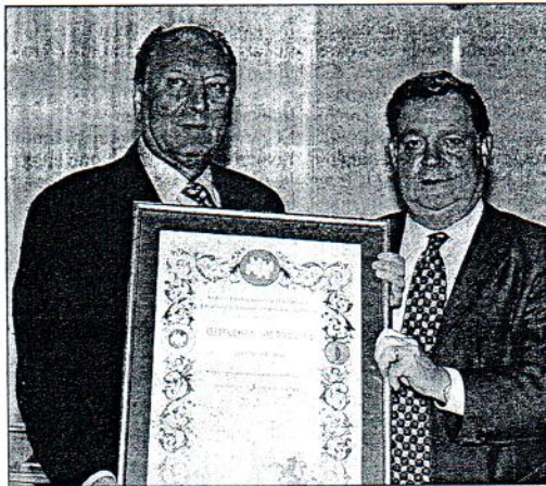
Un momento de la entrega de los diplomas de honor.